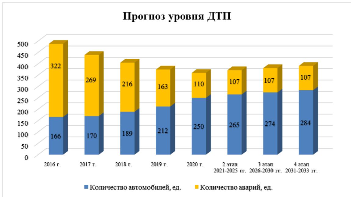
Диаграмма 7. Прогноз уровня ДТП.