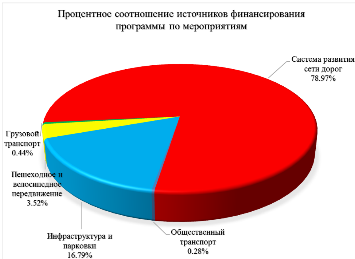
Диаграмма 10. Процентное соотношение источников финансирования программы по мероприятиям.