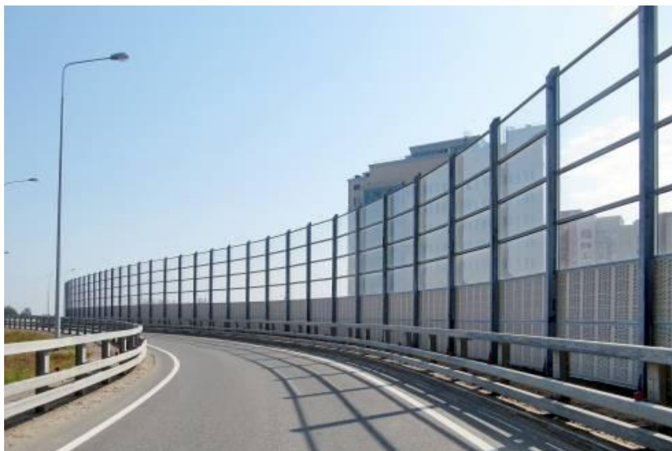
Рисунок 5. Защитное ограждение «защитный экран».

Среди альтернативных типов топлив в настоящее время привлекает внимание целый ряд продуктов различного происхождения: сжатый природный газ, сжиженные газы нефтяного происхождения и сжиженные природные газы, различные синтетические спирты, газовые конденсаты, водород, топлива растительного происхождения и т.д.