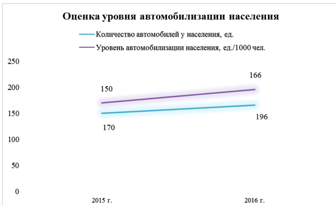
Диаграмма 3. Оценка уровня автомобилизации населения.

Специализированные парковочные и гаражные комплексы отсутствуют. Для хранения транспортных средств используются неорганизованные площадки с самовольно возведенными гаражами преимущественно в металлическом исполнении. Временное хранение транспортных средств также осуществляется на дворовых территориях жилых комплексов.