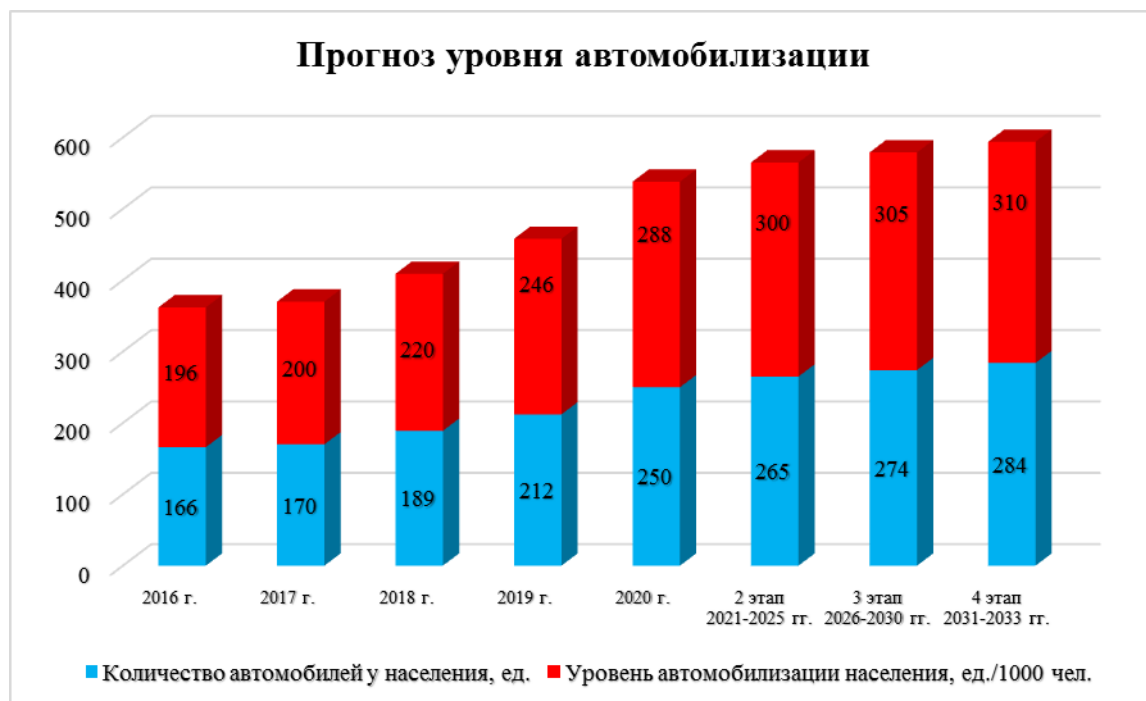
Диаграмма 6. Прогноз уровня автомобилизации.