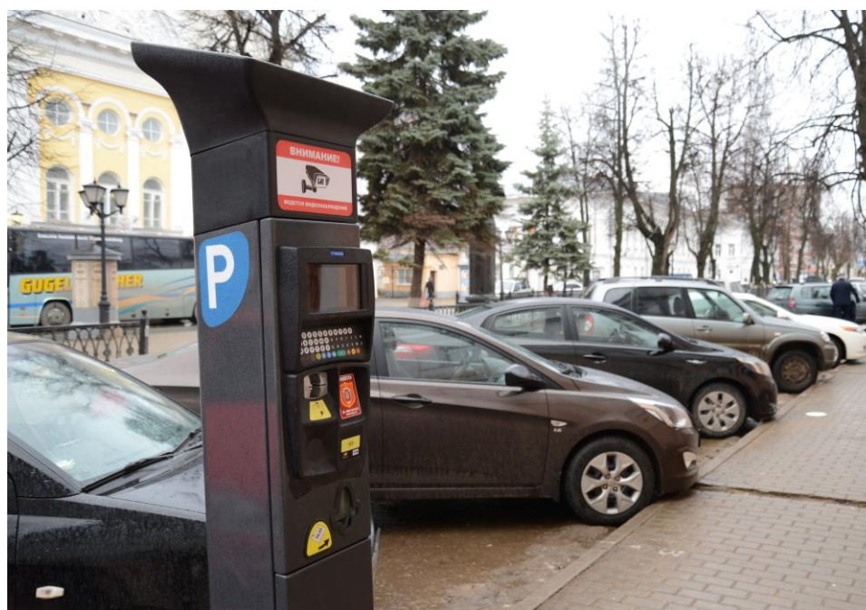
Рисунок 3. Платная парковка.

Улично-дорожную сеть увязывают с планировочной структурой поселения и прилегающей к нему территорией, обеспечивая удобные, быстрые и безопасные транспортные связи со всеми функциональными зонами, с другими поселениями системы расселения, объектами, расположенными в пригородной зоне, объектами внешнего транспорта и автомобильными дорогами общей сети.