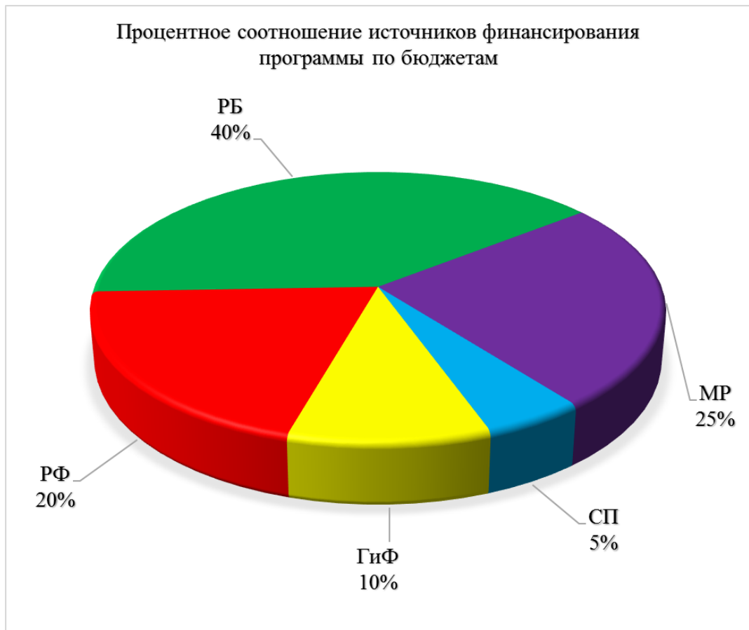
Диаграмма 8. Процентное соотношение источников финансирования программы по бюджетам.