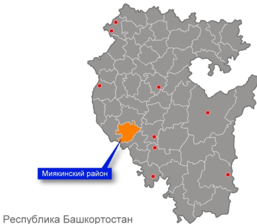
Рисунок 1. Месторасположение Миякинского района на карте Республики Башкортостан.

Территория сельского поселения Ильчигуловский сельсовет находится на севере МР Миякинский район, расположенного в юго-западной части Республики Башкортостан и граничащего с Оренбургской областью. С северной, восточной и северо-восточной части она ограничена землями Альшеевского района, с юга и юго-запада – с землями СП Карановский сельсовет.