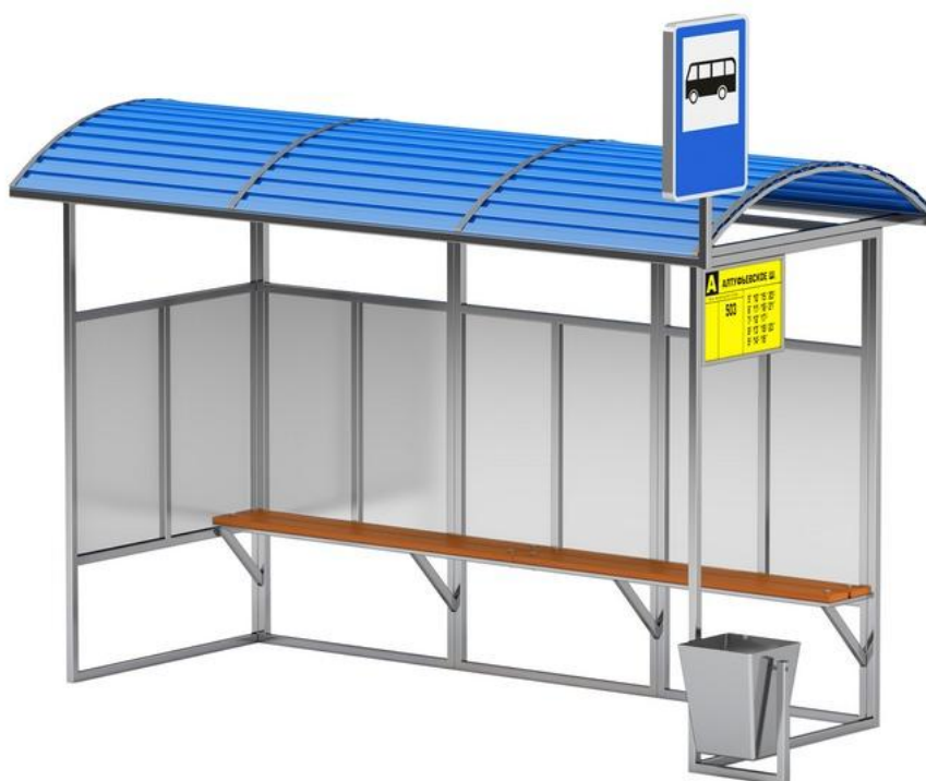
Рисунок 2. Остановка общественного транспорта.

Территория ТПУ, как правило, является собственностью двух или более транспортных фирм либо обслуживает сразу несколько видов транспорта одной фирмы. В отличие, например, от обычных автобусных остановок, на территории ТПУ могут устанавливаться внутренние правила, регламентируемые оплатой проезда в транспорте.