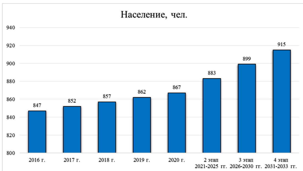
Диаграмма 5. Прогнозная численность населения.