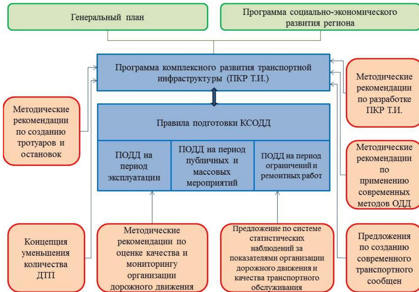
Рисунок 7. Модель Программы комплексного развития транспортной инфраструктуры сельского поселения Ильчигуловский сельсовет Миякинский район на период 2016-2020 годы с перспективой до 2033 года.