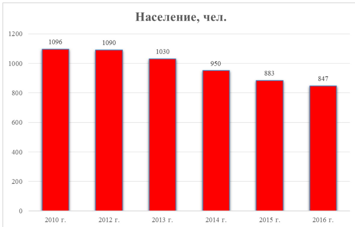
Диаграмма 1. Динамика численности населения.

В Ильчигуловском сельсовете происходит снижение численности населения, это связано с оттоком трудоспособного населения в город. За период с 2012-2016 год население сельсовета уменьшилось. Ранее рост населения происходил преимущественно благодаря положительному естественному приросту населения.