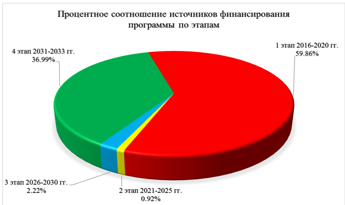
Диаграмма 9. Процентное соотношение источников финансирования программы по этапам.