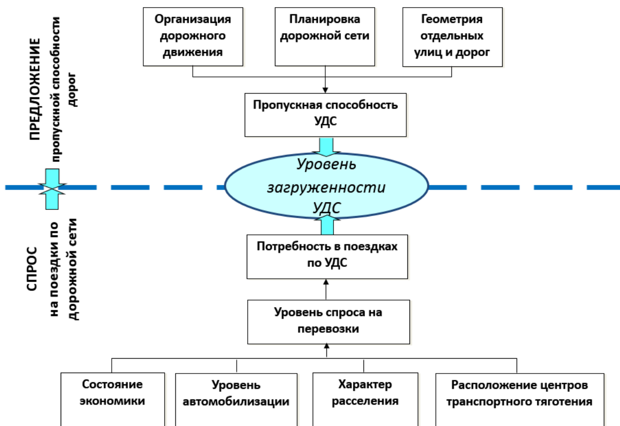
Рисунок 4. Факторы, определяющие уровень загруженности ДС.

5.1. Комплексные мероприятия по организации дорожного движения, в том числе мероприятия по повышению безопасности дорожного движения, снижению перегруженности дорог и (или) их участков.